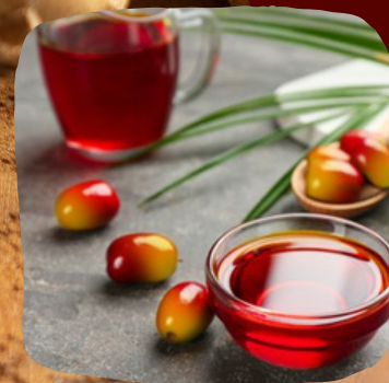
1 FRUTO DO DENZEIRO E ÓLEO DE DENDÊ